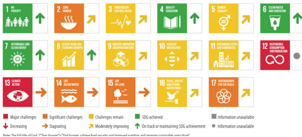
Figura 2. Diagrami i përmbushjes së OZhQ-ve në Finlandë