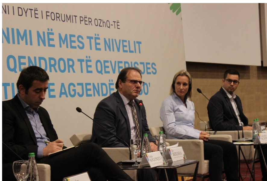
Slika 4. Panel „Tehnička podrška, praćenje i izveštavanje o sprovođenju COR-a na nacionalnom nivou“

Predstavници centralnog nivoa, stranih međunarodnih organizacija i predstavnici privatnog sektora pozvani su na okrugli sto pod nazivom „Tehnička podrška, praćenje i izveštavanje o sprovođenju ciljeva održivog razvoja na nacionalnom nivou“, u nameri da uključi sve relevantne aktere u istinsku primenu COR-a i Agende 2030. u zemlji. Pošto Kosovo još uvek zaostaje u pogledu sprovođenja ciljeva održivog razvoja generalno, učesnici u diskusiji su predstavljali različite sektore. Razlog tome bila je uključenost i mogućnost da se zabeleže izazovi sa kojima se susreću svi sektori kada je reč o primeni Agende 2030.